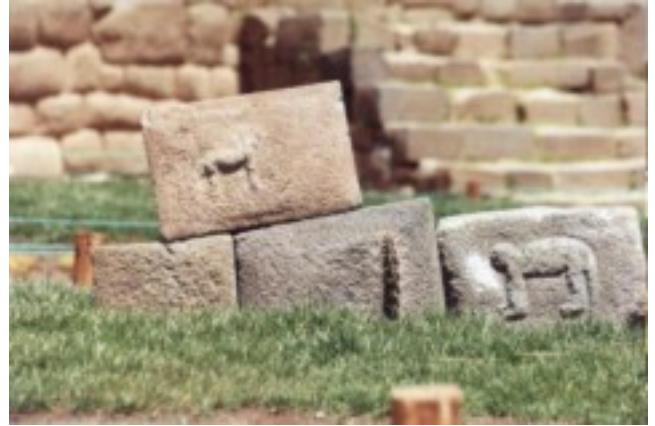
Ruinas incas en Ayacucho ( ampliar imagen )

Entre las expresiones artísticas más impresionantes de la civilización inca se hallan los templos, los palacios, las obras públicas y las fortalezas estratégicamente emplazadas, como Machu Picchu.